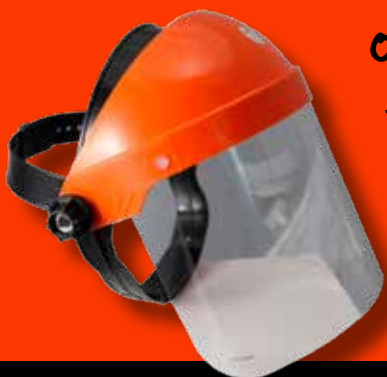
ochranný štít tváre a očí OŠ2

Montáž štítu je jednoduchá, kompletovanie zvládne za niekoľko minút každý sám, podľa návodu.