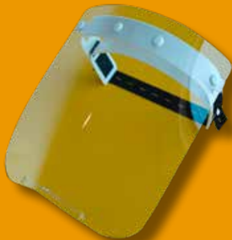
ochranný štít tváre a očí TITAN 1_2